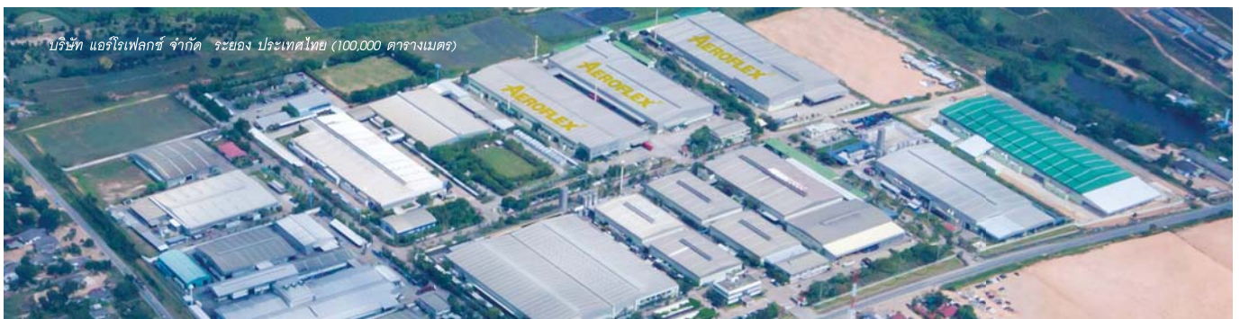
บริษัท แอร์โฟล็กซ์ จำกัด ระยอง ประเทศไทย (100,000 ตารางเมตร)